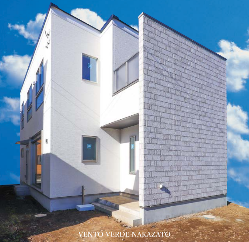
VENTO VERDE NAKAZATO