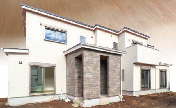
外構工事完成後お引き渡し!