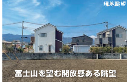
富士山を望む開放感ある眺望