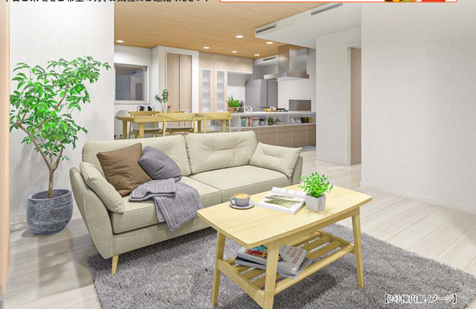
【2号棟内観イメージ】