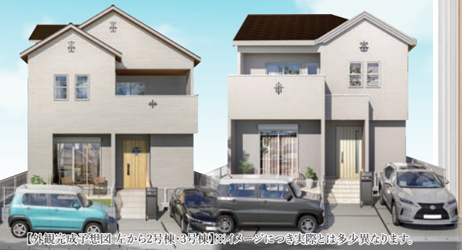
【外観完成予想図】左から2号棟・3号棟 ※イメージにつき実際とは多少異なります。