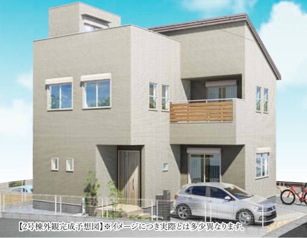
【2号棟外観完成予想図】※イメージにつき実際とは多少異なります。