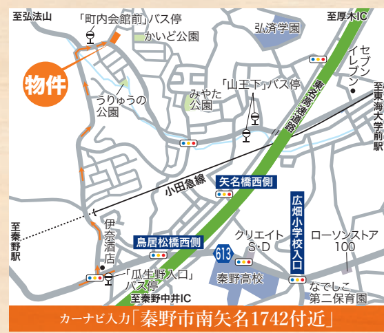
カーナビ入力「秦野市南矢名1742付近」