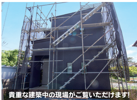
貴重な建築中の現場がご覧いただけます!

お家BBQなど用途豊富な南向きのお庭付! 21.2帖のLDK! キッチンにはパントリー付! 2階には家族で使用できるウォークインクローゼット有!