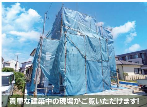
貴重な建築中の現場がご覧いただけます!