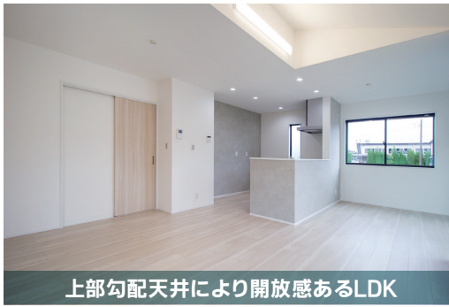
上部勾配天井により開放感あるLDK