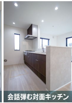
会話弾む対面キッチン