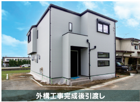
外構工事完成後引渡し