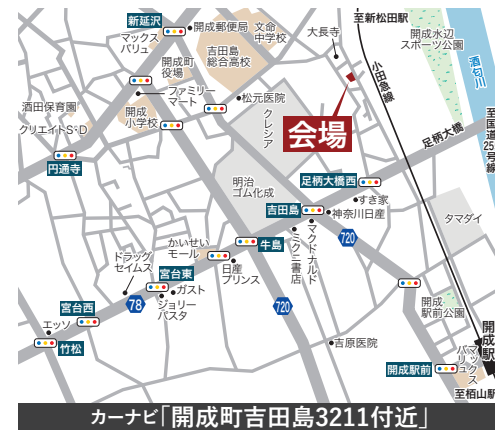
カーナビ「開成町吉田島3211付近」