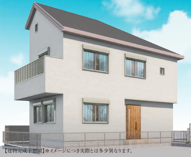
【建物完成予想図】※イメージにつき実際とは多少異なります。