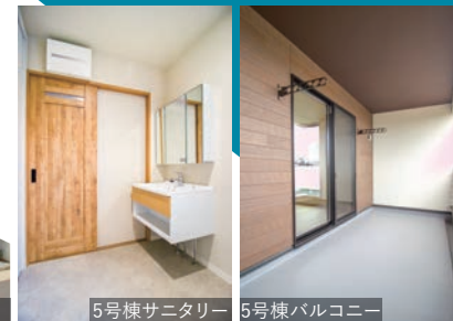
5号棟サニタリー 5号棟バルコニー