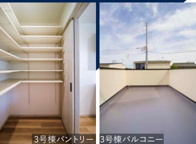
3号棟パントリー 3号棟バルコニー