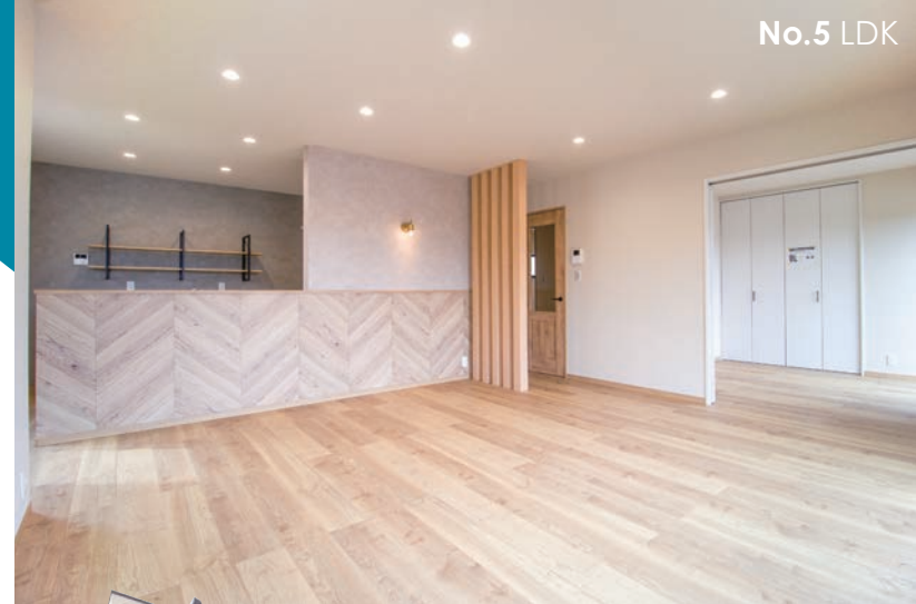
NATURAL MODERN STYLE