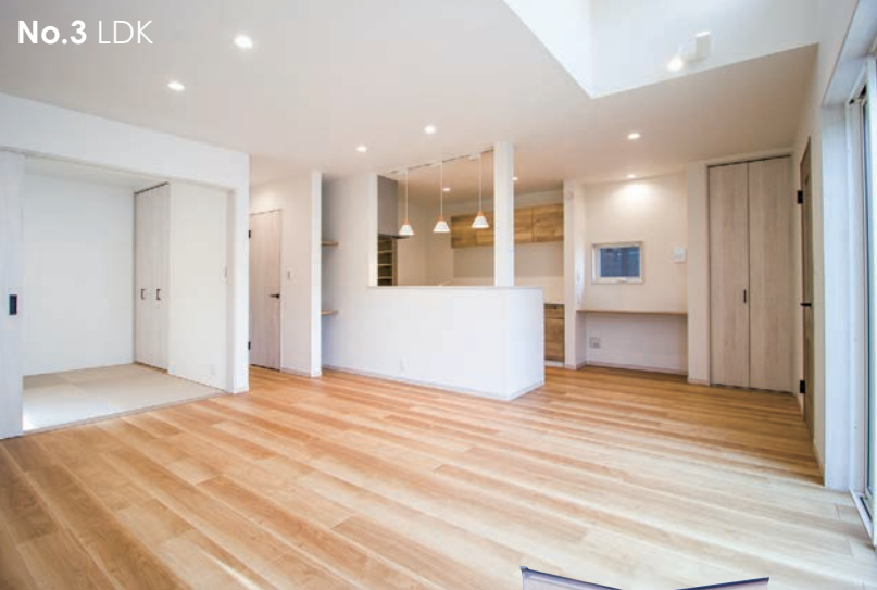
STYLISH MODERN STYLE