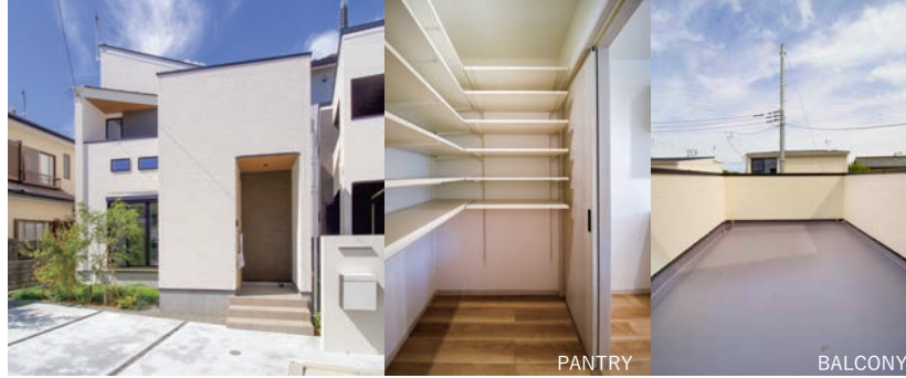
MACKENZIE HOUSE VENTO VERDE SERIES YOSHIDAJIMA KAISEI TOWN

3LDK +SERVICEROOM+WIC +FAMILY CLOSET+PANTRY