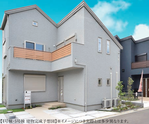
【4号棟・5号棟 建物完成予想図】※イメージにつき実際とは多少異なります。