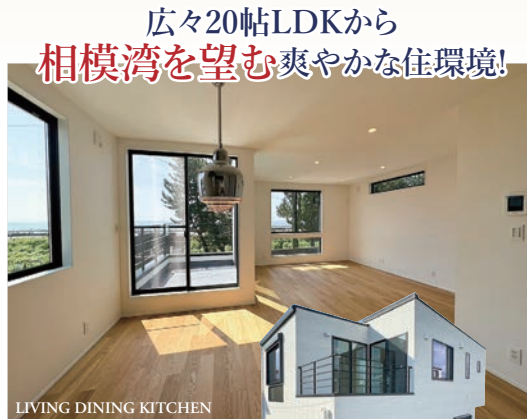
LIVING DINING KITCHEN