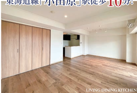
LIVING DINING KITCHEN

令和6年6月内装リフォーム完了 水回り交換(トイレ・浴室・洗面・キッチン) フローリング張替え、壁紙張替え、ガス給湯器交換 ペット飼育可(細則有)