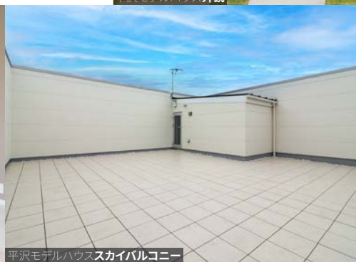
平沢モデルハウススカイバルコニー