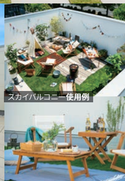
スカイバルコニー使用例

シンプルで四角い箱だからこそ、自分のスタイルに自由にアレンジができる。 部屋を一つ追加してアトリエにしたり、屋上バルコニーでお家キャンプをしてみたり。 壁紙や家具でイメージを変えるのも、何を飾るかも自分次第。 そんなベーシックなスケルトンの形。スタンダードハウスZERO-CUBE。