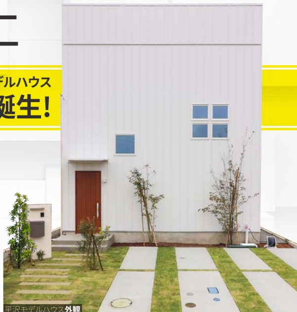
平沢モデルハウス外観