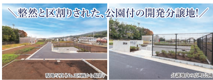
整然と区割りされた、公園付の開発分譲地!

* 建築条件なし、全24区画中今回販売15区画、道路幅員4.0m・4.5m・6.0m、計画道路の予定があるので建築時には53条の許可が必要です。