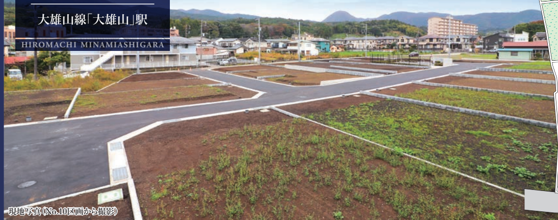
現地写真(No.10区画から撮影)