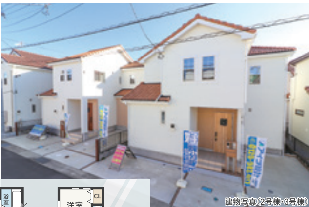
建物写真(2号棟・3号棟)