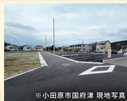
※小田原市国府津 現地写真