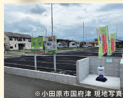
※小田原市国府津 現地写真